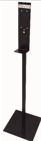
HGPT0020B Acabado negro mate